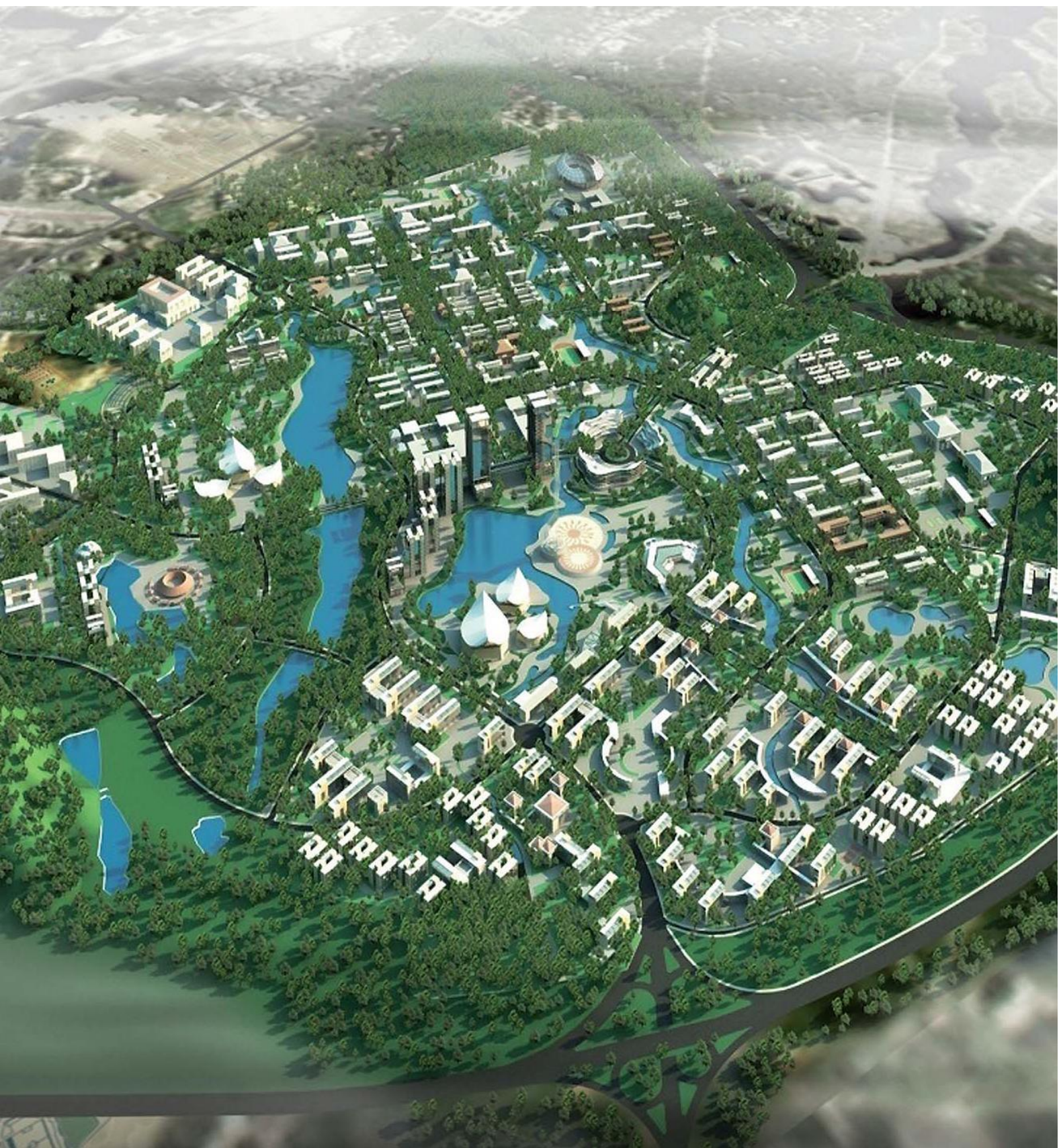
Phối cảnh quy hoạch chung dự án ĐHQGHN tại Hòa Lạc