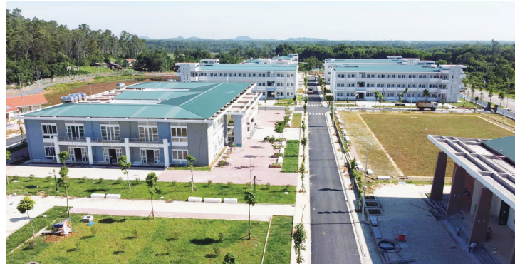
Khu QGHN04 sau khi hoàn thiện.