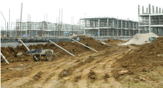
Xây dựng khu QGHN04.

người và ý chí vì sự phát triển ĐHQGHN như được tiếp thêm niềm tin, động lực để vươn cao và xa hơn nữa".