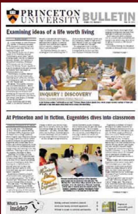
>> Bản tin Đại học Princeton - Cơ quan ngôn luận của Đại học Princeton

học Princeton nổi danh khắp thế giới và luôn đứng thứ hạng hàng đầu trong các bảng xếp hạng uy tín thế giới. Và với vị thế là cái nôi đào tạo nhân tài và nhiều cựu sinh viên thành đạt, khiến Princeton có các khoản hiến tặng vào loại lớn nhất thế giới.