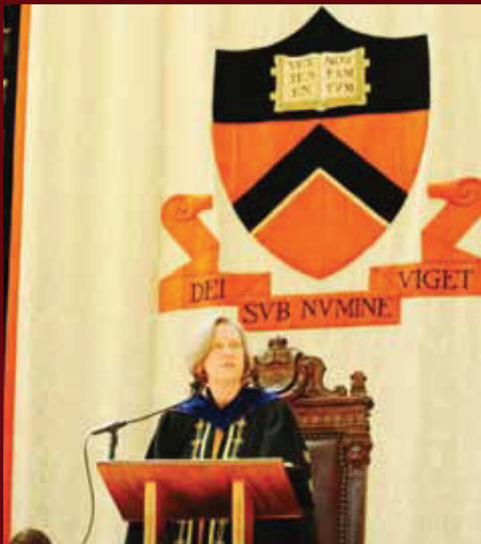
>> GS. Shirley M. Tilghman - Giám đốc Đại học Princeton