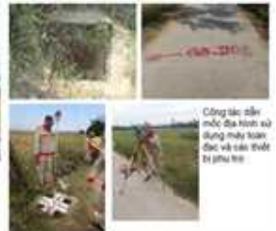
Công tác xây dựng địa hình sử dụng máy toàn đạc và các thiết bị phụ trợ

Ngày 28/12/2021, trong khuôn khổ dự án “Phát triển môi trường, hạ tầng đô thị để ứng phó với biến đổi khí hậu thành phố Đồng Hới vay vốn Ngân hàng Phát triển Châu Á (ADB)”, Trung tâm Động lực học Thủy khí Môi trường (CEFD, trường Đại Học Khoa Học Tự Nhiên) cùng đơn vị tư vấn, phối hợp với Ban Quản lý dự án Môi trường và biến đổi khí hậu thành phố Đồng Hới đồng tổ chức Hội thảo Tổng kết gói thầu DH/C1: Quản lý tích hợp bờ biển thành phố Đồng Hới. Buổi hội thảo được tổ chức theo hình thức trực tiếp kết hợp trực tuyến.