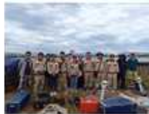
Cán bộ CEFD tổng duyệt khảo sát địa điểm xây dựng lỵ học và địa đặc địa hình đây biển (bên này)