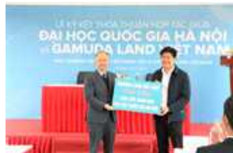
Tổng Giám Đốc Gamuda Land Việt Nam trao tặng tài trợ

và chuyển giao công nghệ, thúc đẩy hợp tác quốc tế trong các lĩnh vực: Bảo vệ thiên nhiên và Môi trường; Xử lý chất thải; Khoa học xã hội và nhân văn; Đô thị thông minh; Kỹ thuật số, đổi mới và sáng tạo. Hàng năm, Gamuda Land Việt Nam sẽ tài trợ học bổng cho học sinh, sinh viên, học viên sau đại học và hỗ trợ nghiên cứu khoa học., đồng thời xem xét tài trợ một số phòng thí nghiệm đặt tại ĐHQGHN. Về công tác an sinh xã hội,