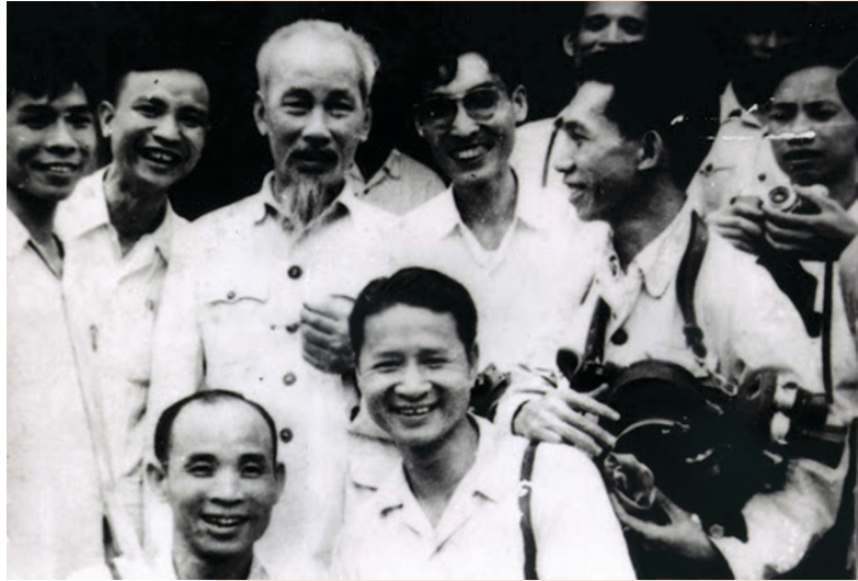
Bác Hồ và các nhà báo tại Đại hội lần thứ II, Hội Nhà báo Việt Nam, ngày 16/4/1959.

Nghị quyết của Bộ Chính trị 8/12/1958 khẳng định: Cán bộ báo chí cũng là chiến sỹ cách mạng. Cây bút, trang giấy là vũ khí sắc bén của họ. Để làm tròn nhiệm vụ vẻ vang của mình, Bác Hồ dạy, “... cán bộ báo chí cần phải tu dưỡng đạo đức cách mạng, cố gắng trau dồi tư tưởng, nghiệp vụ và văn hoá; chú trọng học tập chính trị để nắm vững chủ trương của Đảng, chính sách của Chính phủ; đi sâu vào thực tế, đi sâu vào