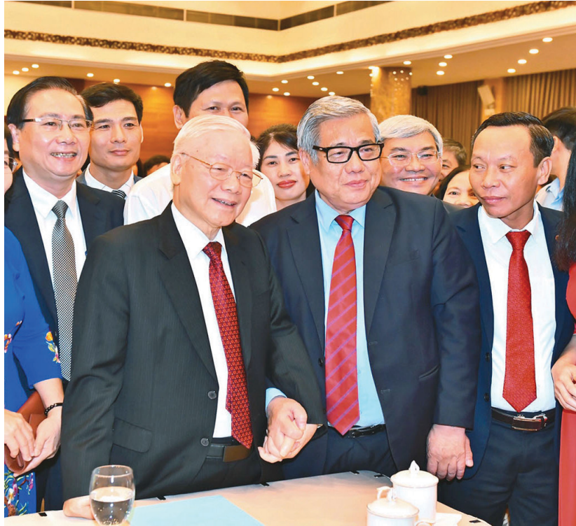
Tổng Bí thư Nguyễn Phú Trọng gặp mặt các trí thức tại lễ kỷ niệm 60 năm Chủ tịch Hồ Chí Minh gặp mặt đội ngũ trí thức và 40 năm thành lập Liên hiệp các hội Khoa học và Kỹ thuật Việt Nam.

Đặc điểm đã hình thành xa xưa là đội ngũ trí thức có mối quan hệ rất gần gũi với quần chúng nhân dân. Không giống với nhiều quốc gia phong kiến khác, ranh giới đẳng cấp trong xã hội Việt Nam trung đại không ngăn cản con em nông dân nghèo ứng thí. Nhiều tiến sĩ có xuất thân bình dân, thậm chí còn là con em của những nông dân nghèo nên khi có vị trí trong bộ máy quản lý nhà nước luôn có tình cảm thân thiết và quan hệ gần bó với nhân dân. Từ khi Đảng trở thành tổ chức lãnh đạo hệ thống chính trị, đội ngũ trí thức công càng có điều kiện phát huy đặc điểm này.