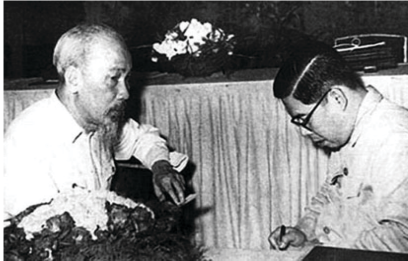
Chủ tịch Hồ Chí Minh làm việc với Giáo sư, Viện sĩ Trần Đại Nghĩa.

ĐẤT NƯỚC VIỆT NAM ĐANG CÓ MỘT CƠ ĐỒ LỚN ĐỂ CÓ THỂ THỰC HIỆN KHÁT VỌNG ĐƯA DÂN TỘC ĐI TỚI PHỒN VINH. HƠN BAO GIỜ HẾT, CHÚNG TA PHẢI ĐÙ KHẢ NĂNG BIẾN TẤT CẢ NHỮNG GÌ NGƯỜI VIỆT NAM CÓ THÀNH LỢI THỂ ĐƯA ĐẤT NƯỚC ĐI LÊN. TRONG SỰ NGHIỆP VĨ ĐẠI NÀY, ĐỘI NGŨ TRÍ THỨC DƯỚI SỰ LÃNH ĐẠO CỦA MỘT ĐẢNG CHÍNH TRỊ ĐẦY TRÍ TUỆ SẼ ĐÓNG VAI TRÒ CỰC KỲ QUAN TRỌNG.