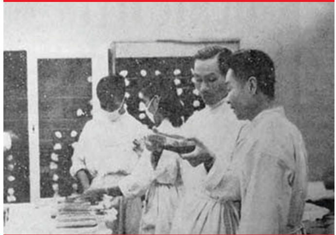
Giáo sư Trần Đại Nghĩa (ảnh trên) và bác sỹ Đặng Văn Ngữ là những trí thức lớn ở nước ngoài về nước tham gia kháng chiến kiến quốc.

đã ra sức học tập để tự trở thành một trí thức, trong hàng ngũ các nhà lãnh đạo Đảng và Nhà nước luôn có những trí thức uyên bác. Đây là hệ quả của truyền thống văn hoá Việt Nam, đặc điểm này lại trở thành tiền đề và môi trường thuận lợi cho trí thức Việt Nam phát huy vai trò của mình trong sự nghiệp xây dựng và bảo vệ Tổ quốc.