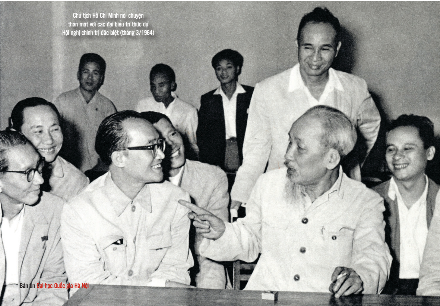
Chủ tịch Hồ Chí Minh nói chuyện thân mật với các đại biểu trí thức dự Hội nghị chính trị đặc biệt (tháng 3/1964)

Sau khi lãnh đạo cuộc cách mạng giải phóng dân tộc thành công vào tháng Tám năm 1945, Chủ tịch Hồ Chí Minh đã thể hiện rõ tư tưởng trọng trí thức khi xây dựng Chính phủ lâm thời. Người đã quy tụ xung quanh mình rất nhiều những trí thức yêu nước có tài, có đức