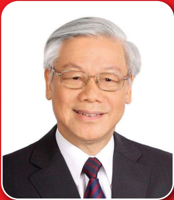
Tổng Bí thư Nguyễn Phú Trọng